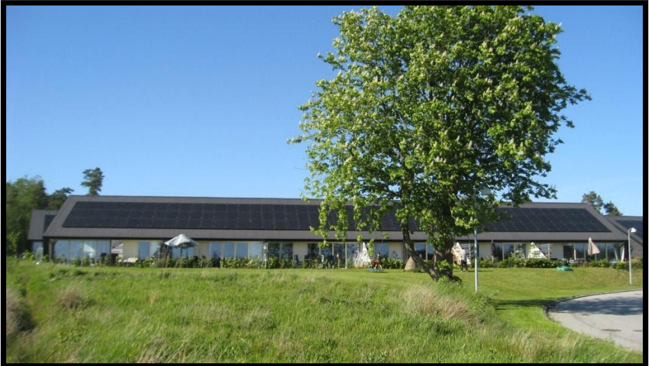
Afdeling 90 – Østjysk Bolig