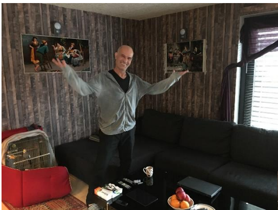
Mehdis hjem med forskelligt tapet på væggene, ret så kunstnerisk 😊